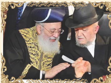
ראש ישיבת "כסא רחמים" הרב מאיר מאוזו שליט"א עם הראשון לציון ורבה של ירושלים הרב שלמה עמאר שליט"א